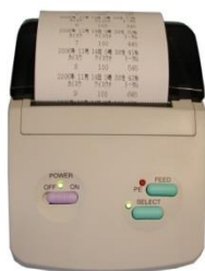
ジャーナルプリンター