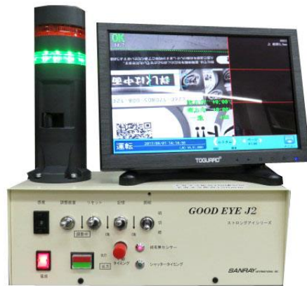
上カメラのみ検査

高機能 CMOS カメラで画像がクリア、RGB モニターは高視野角、高繊細画面 カメラはモノクロですが、メニューその他画面表示がカラーで見やすい 少ロット、多品種でも視野内に文字、対象物があれば記憶ボタンを押すだけでセット完了 位置ズレ感度を簡単にデジスイッチで切替可能 乱丁・ズレ・曲り等も検知可能 パトライトでタイミングの状態が見えます 照明の明るさは2段階切替可能、上カメラ 1,000mm の場合室内照明、下カメラ白色 LED 照明 オプションで絵柄カメラと表裏判別センサ同時使用可能