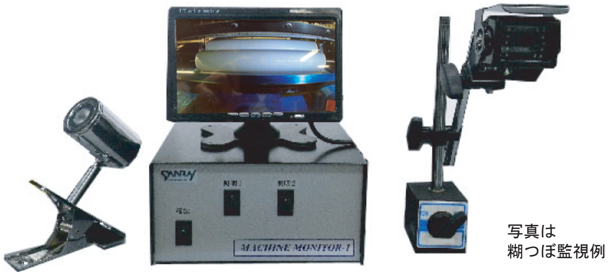
写真は 糊つぼ監視例